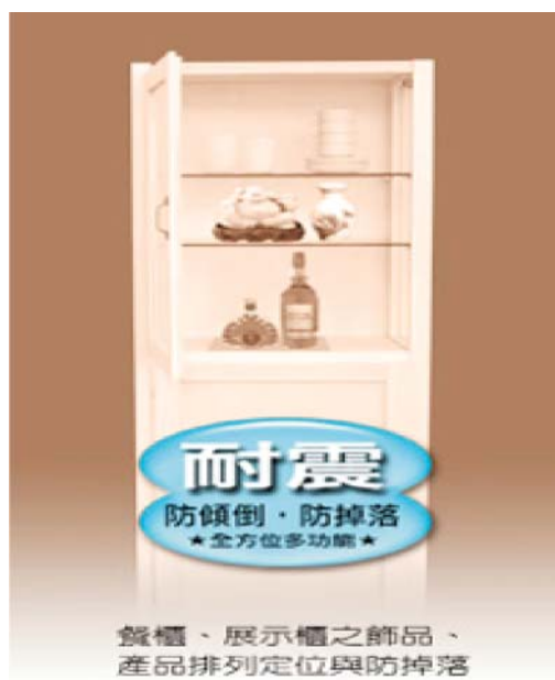
圖三 產品宣傳海報