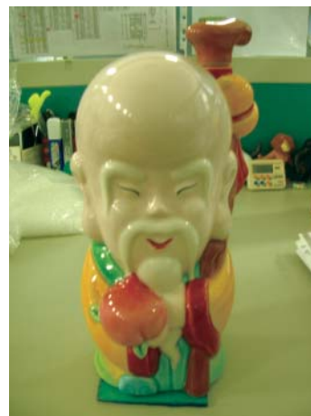
圖一 產品使用示範土地公 公站在黏滑墊上